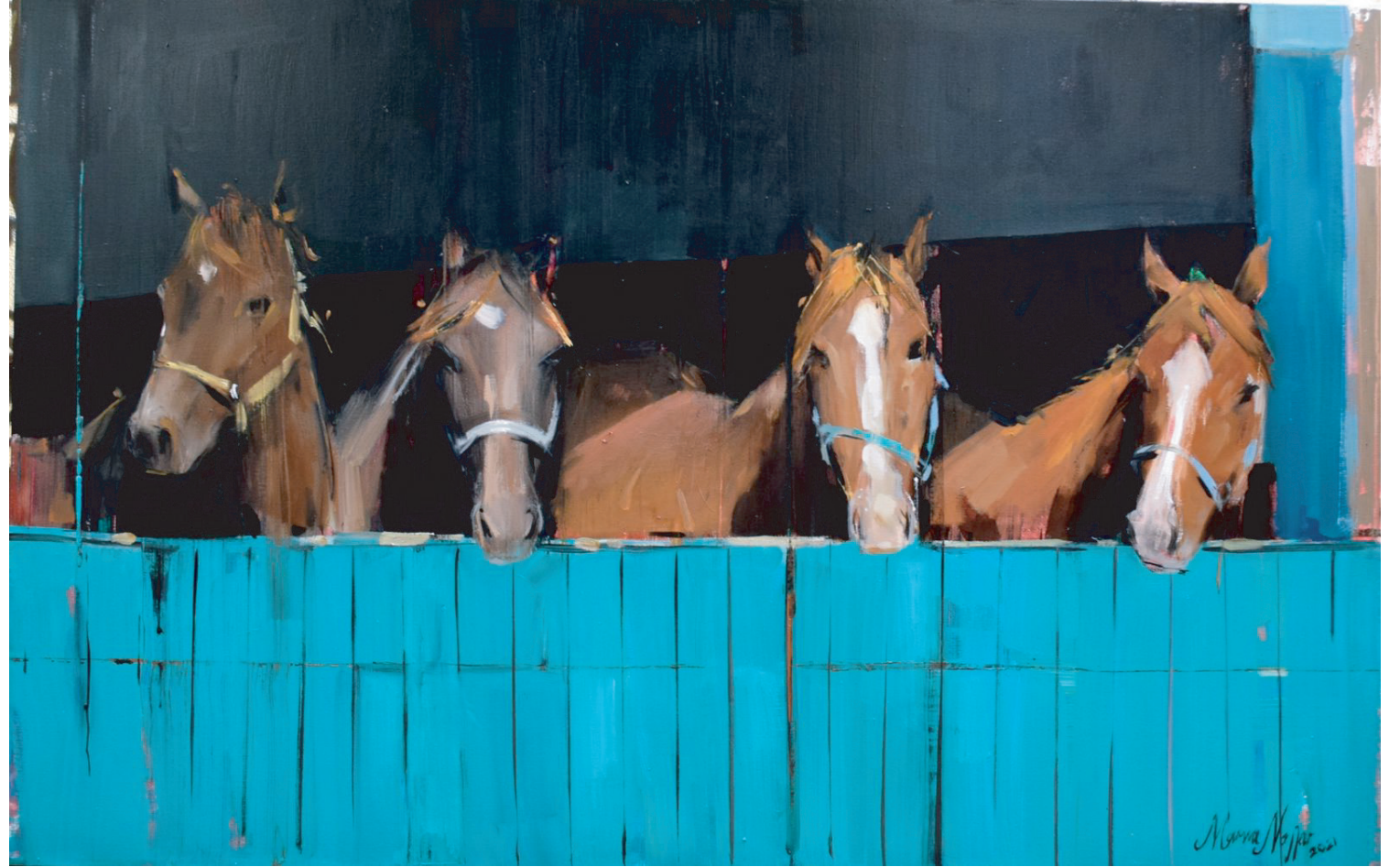
اسطبل ٩٠ × ١٤٠ زيت على قماش 140 x 90 Oil on Canvas