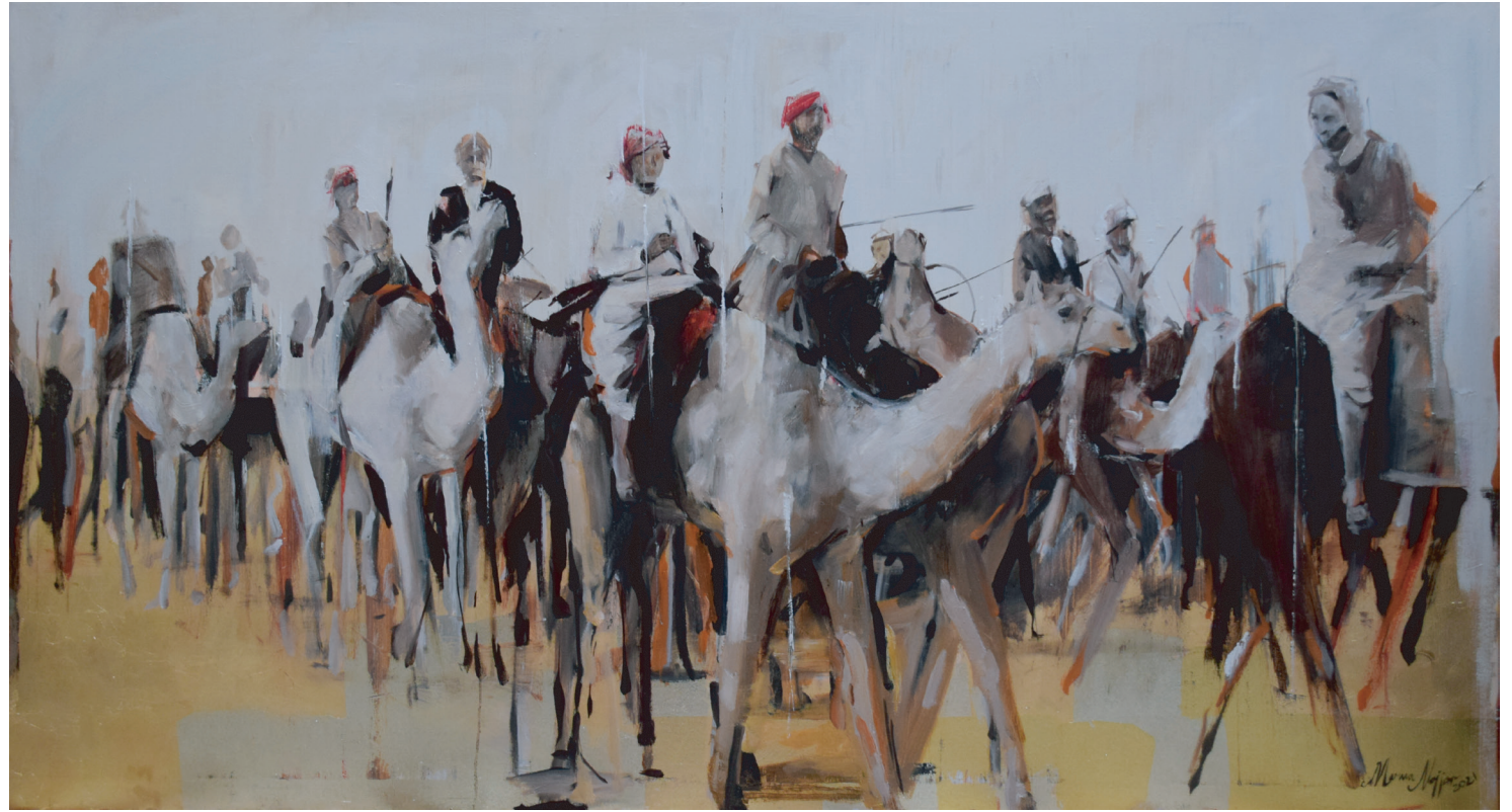
قافلة ٢١٠ x ٢٠٠ زيت وورقة ذهبية على قماش 200 x 210 Oil & Gold Leaf on Canvas